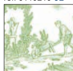
Délices des 4 Saisons réf. 0140210 58