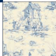
réf. 0111110 40 Bleu fond bis