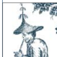
réf. 0459390 49 Encre