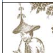
réf. 0459390 75 Taupe