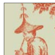
réf. 0459390 617 Clémentine fond Lin