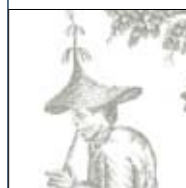
réf. 0459390 94 Gris