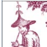
réf. 0459390 22 Cassis