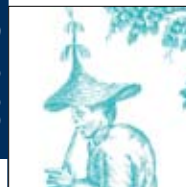
réf. 0459390 37 Turquoise