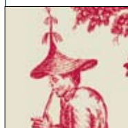
réf. 0459390 087 Rouge fond Lin