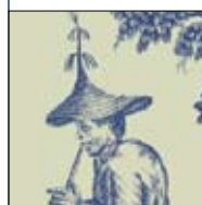
réf. 0459390 387 Indigo fond Lin