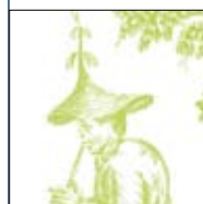
réf. 0459390 51 Anis