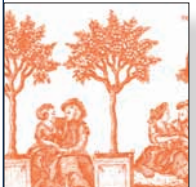
réf. 0497930 67 Tangerine