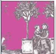
réf. 0497930 531 Tyrien