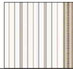
Zéphyr & Séraphin réf. 0497930 67