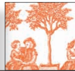
Zéphyr & Séraphin réf. 0497930 95